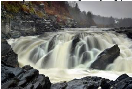
Ang kagandahan ng kalikasan. Ang Grand Falls ng Chaudiere River malapit sa St. Georges, Quebec.

Siya ang tanging-makapangyarihang Hari at ang Tagapagligtas, ang Mapagmahal na Diyos, na puno ng karunungan. Walang sinuman ang makapagbabago ng Kanyang desisyon. Ang mga Anghel, mga Propeta, mga nilalang, at ang mga hayop at lahat ng uri ng halaman ay nasa ilalim ng Kanyang pangangalaga.