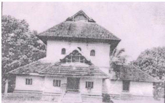
Фото древнейшей мечети в Индии Чераман Джум'а Масджид (пятничная мечеть Черамана) до реконструкции.

Сопровождение короля во главе с мусульманином Маликом бин Динаром достигло города Кодунгаллур, столицы государства Чера. Они построили первую в Индии мечеть примерно в 629 г., которая существует и сегодня.