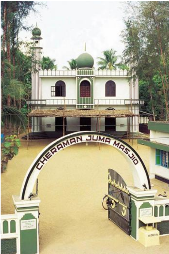
Чераман Джум'а масджид после реконструкции.

Встреча Мухаммада, да благословит его Аллах и приветствует, и короля Индии описана также в мусульманских источниках. Известный исламский историк Ибн Касир упоминает, что расколотую луну наблюдали в нескольких местах Индии. В хадисах также говорится о прибытии короля Индии и его встрече с пророком. Абу Саид Аль-Худри, сподвижник пророка, рассказывает: