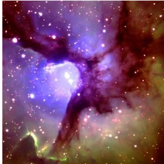
Figura 1 Região central da Nebulosa Trífide vista pelo Telescópio Gemini em Mauna Kea na Grande Ilha do Havaí, 5 de Junho, 2002. Localizada na constelação de Sagitário, a bela nebulosa é uma nuvem de gás e poeira onde nascem estrelas. Uma das estrelas massivas no centro da nebulosa nasceram aproximadamente 100.000 anos atrás. A distância entre a nebulosa e o Sistema Solar é considerada em torno de 2.200 a 9.000 anos luz.

irracional. Deve haver, me parece, um nível mais profundo de explicação.” O universo, a terra, e as coisas vivas na terra dão testemunho silencioso a um Criador inteligente e poderoso.