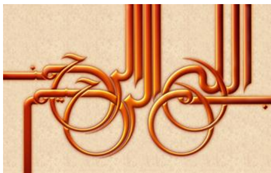
“Au nom de Dieu, Le Tout Clément, Le Très Miséricordieux.” Calligraphie de Yousef, un artiste hollandais.

Ces noms rappellent constamment au musulman qu'il est entouré par la miséricorde divine. À part un seul, tous les chapitres du Coran commencent par la phrase, « Au nom de Dieu, Le Tout Clément, Le Très Miséricordieux ». Avant de manger, de boire, d'écrire une lettre ou d'entreprendre quelque chose d'important, les musulmans disent ou écrivent « au nom de Dieu » afin de Lui exprimer leur totale dépendance et de se rappeler de Sa Grâce. La spiritualité fleurit dans le quotidien. Cette invocation, au début de chaque acte quotidien banal, lui confère de l'importance, et invoquer la bénédiction divine sur cet acte le purifie. La formule « Au nom de Dieu, Le Tout Clément, Le Très Miséricordieux » est un motif de décoration souvent utilisé dans les manuscrits et dans les ornements architecturaux.